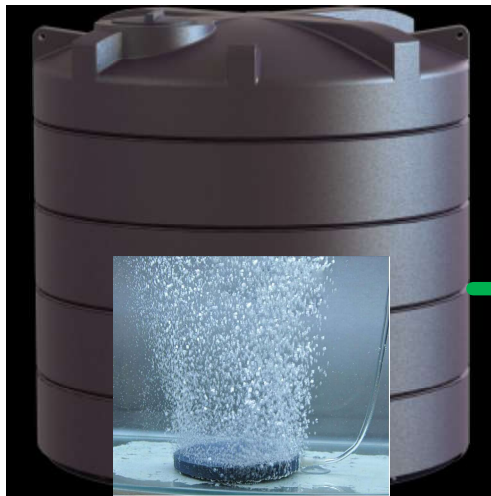
Estanque de aguas tratadas